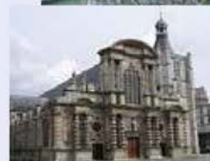
Le Havre et Sainte-Adresse

17 juin 2018 : Visite : Pont-de-l'Arche et son église Rendez-vous à 14h 30 devant l'église.