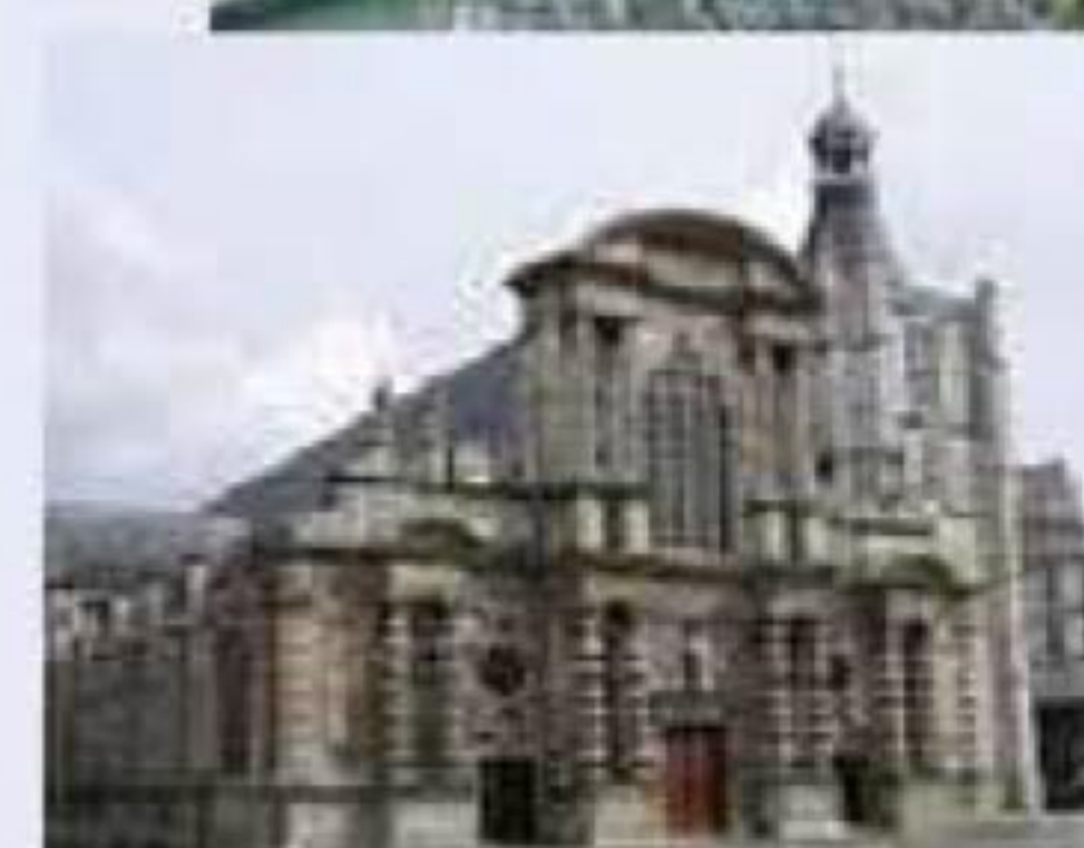
Le Havre et Sainte-Adresse

24 juin 2018 : [date modifiée] Visite : Pont-de-l'Arche et son église Rendez-vous à 14h 30 devant l'église.